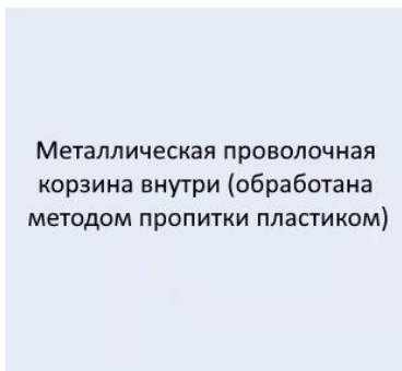
Металлическая проволочная корзина внутри (обработана методом пропитки пластиком)