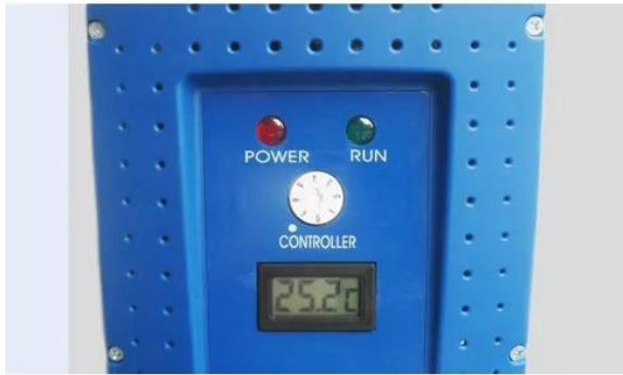
Механический регулятор температуры, электронный контроллер опционально