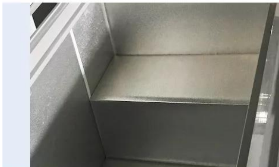
С тисненым вкладышем из алюминиевого листа, опционально с белым порошковым покрытием.