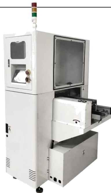
Товар может отличаться от представленного изображения