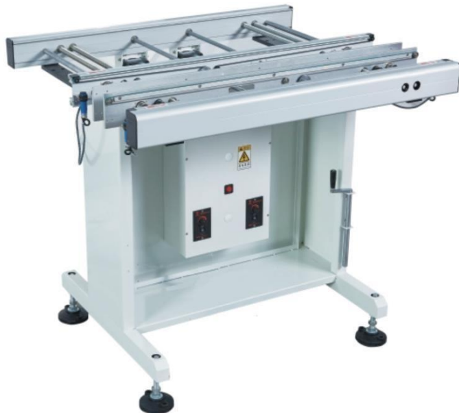
Товар может отличаться от представленного изображения