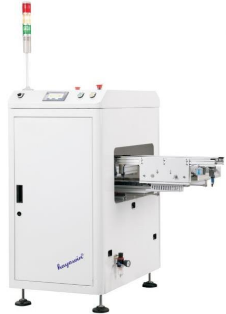
Товар может отличаться от представленного изображения