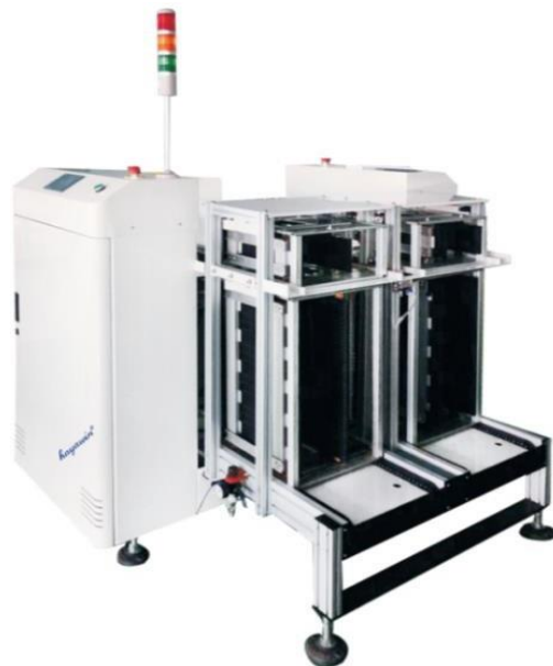
Товар может отличаться от представленного изображения